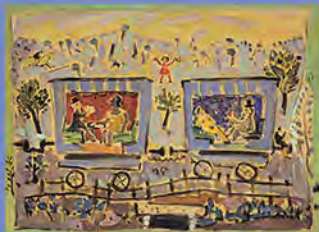
Στο χωριό, 1953